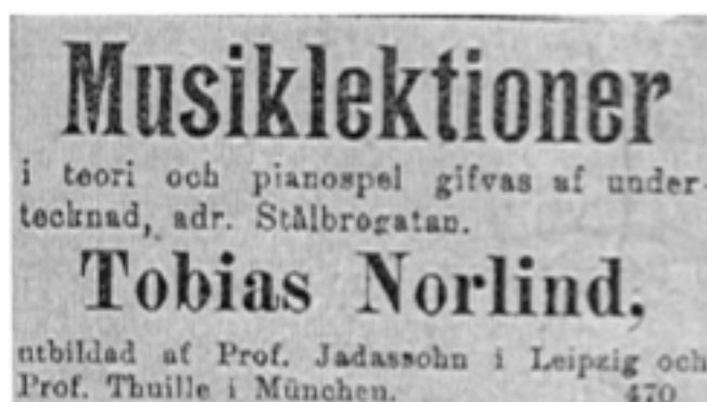
Fig 2. Annonns införd i Lunds Dagblad 24 januari 1903.

upptäckt ett fel som borde ha rättats. Där står det ”att Gunnar Wennerberg dog i Stockholm, hvilket ju icke var fallet!” 67